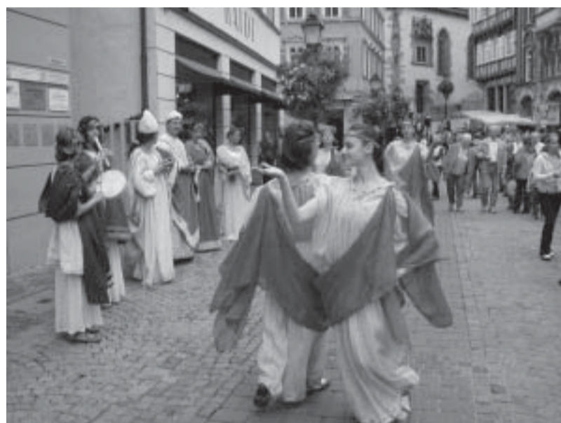
Esibizione delle danzatrici Velimna nel centro storico di Tubingen.

grande successo, che auspichiamo faccia da trampolino per la manifestazione ponteggiana dedicata agli Etruschi per ulteriori future esperienze e collaborazioni con le altre città gemellate con Perugia.