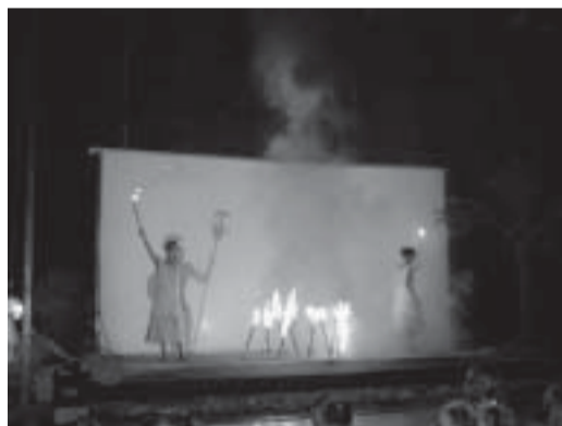
Il rito del fuoco

Alla fine, con un pizzico di incoscienza che contraddistingue un po' tutti gli artisti, decisi di accettare l'incarico prima ancora di informare la compagnia, senza avere la benché minima idea sul copione da mettere in scena, confidando che comunque, pri-