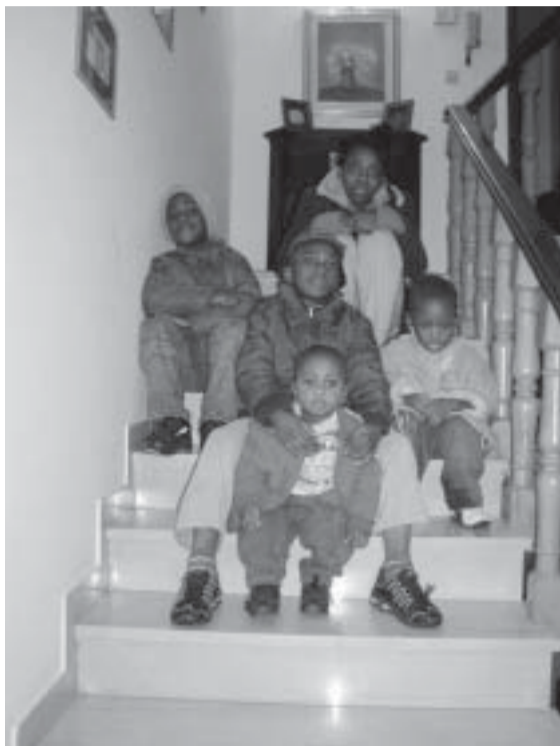
Alcune “colonne” della Ponte San Giovanni multi-etnica di domani.

Prima di tutto ringraziamo per questa opportunità che ci offrite per far sentire la nostra voce in un mondo,