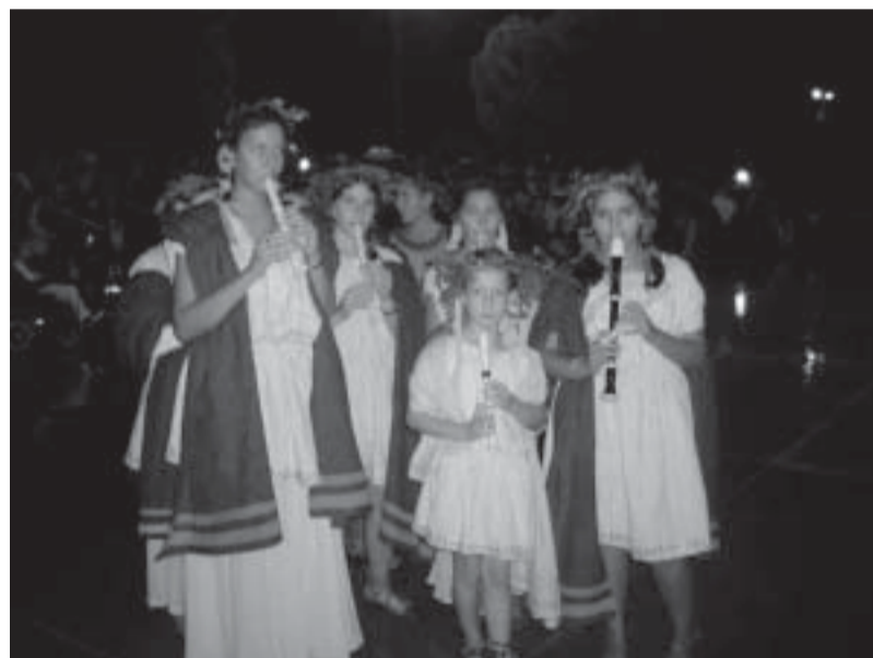
Musici in sfilata