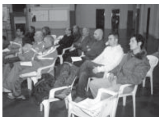
I volontari che hanno partecipato al corso di formazione in attesa di ricevere l'attestato di "Esecutore BLS"