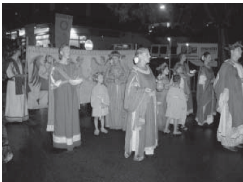
Sacerdotesse e bambini mentre sfilano