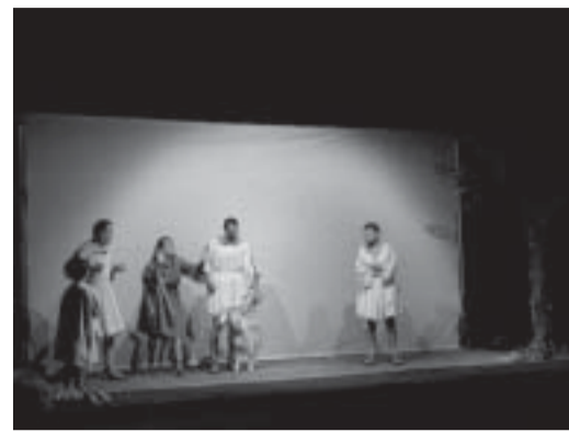
Preparazione al sacrificio della capra

In genere un autore o un regista non è mai pienamente soddisfatto del suo "prodotto finito", ma in questo caso devo ammettere che il risultato finale è stato, a mio giudizio, superiore alle aspettative, confortato anche dal notevole successo di pubblico riscontrato e di questo devo ringraziare ogni singolo componente della compagnia "Teatrodicolle" per la serietà e l'impegno profuso