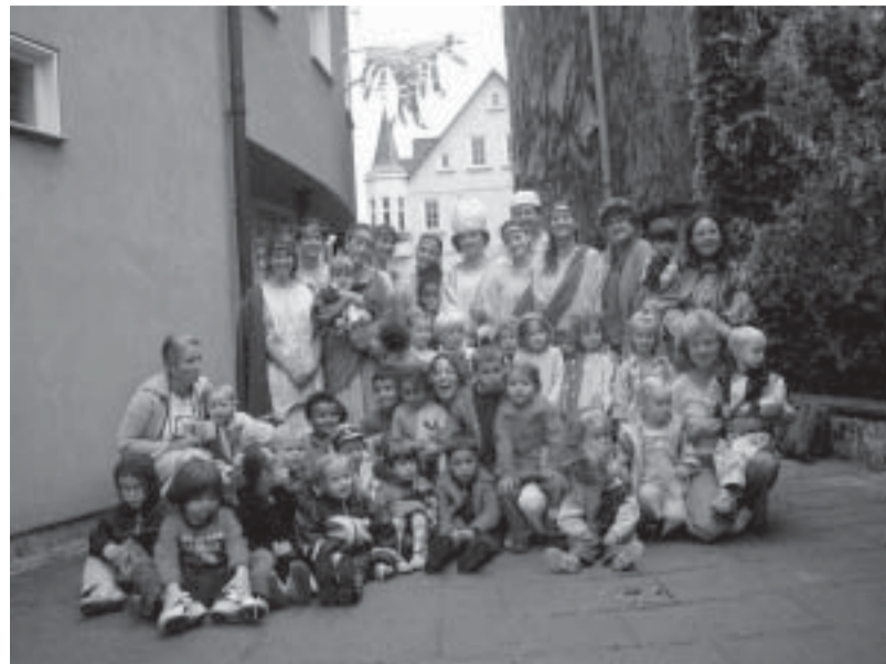
Il gruppo Velimna con i bambini dell'asilo nido "Rubenloch".

Il momento più simpatico e gratificante per il