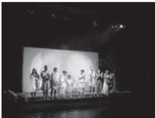
La compagnia "Teatrodicolle"

Stavo, comunque, valutando tutte le difficoltà che erano tante ed importanti, non ultimi i costi e l'onere di convincere la compagnia