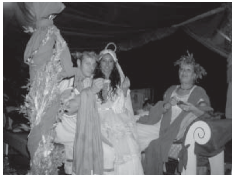
Sposi etruschi mentre banchettano