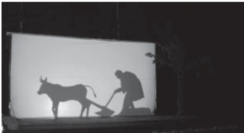
Il contadino Tarchon l'Etrusco prima dell'apparizione di Tace il Dio bambino