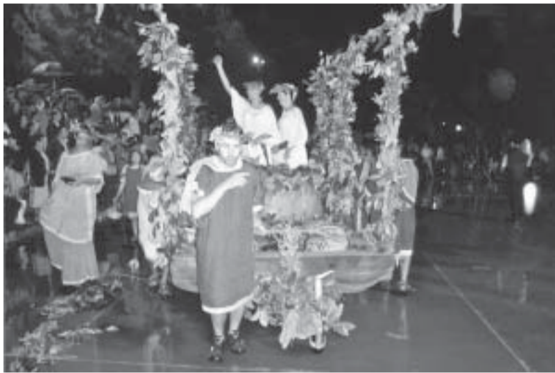
Carro con i popolani mentre pigiano l'uva nel timo

La quarta edizione della manifestazione ha fatto registrare un successo crescente sia tra il pubblico che tra gli addetti ai lavori