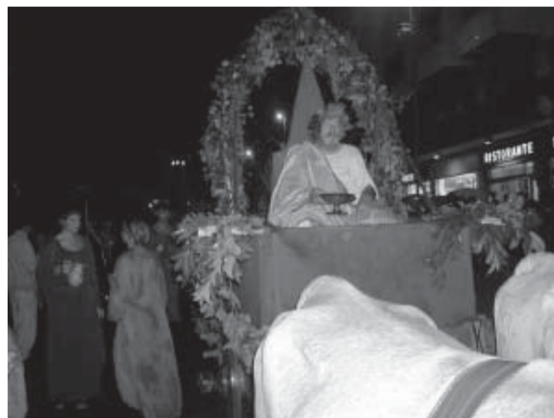
Il Dio Bacco (Funfluns)