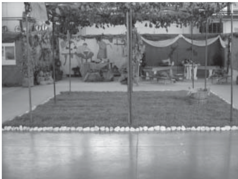
Mostra CVA: pergolato con vista su cucina e stanza dei triclini

Alcuni spunti per ricordare le tappe più coinvolgenti della sfilata lungo Ponte San Giovanni e le iniziative svoltesi al C.V.A.