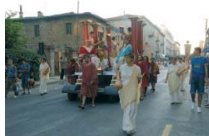
Carro dei Lucumoni con schiavi e ancelle