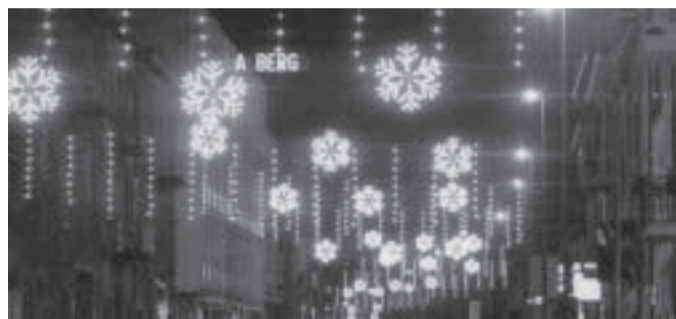
Natale 2005 in via Manzoni.

A fronte di tutto questo, e anche a discapito sia dei commercianti che si sono sempre comportati con correttezza e comprensione sia di tutta la cittadinanza, i consiglieri non hanno dato la loro disponibilità per l'edizione 2006. Nella recente assemblea aperta a tutti gli operatori si è cercato di trovare forze nuove per non do-