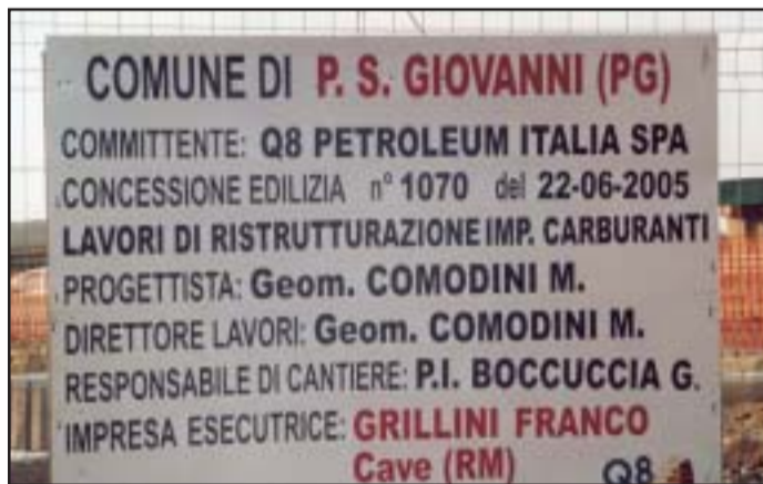
L'involontaria provocazione nel cartello incriminato.