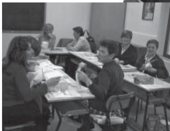
Università della Terza Età: alcune partecipanti al corso di ricamo antico