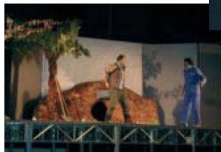
Un momento della rappresentazione

Sfogliando un opuscolo sui siti etruschi, rimasi colpito dalla foto di una tomba sulla quale era stata cancellata, raschiata in profondità, l'epigrafe, al posto della quale era stata incisa la parola AISIAS, "senza nome"; per qualche misterioso motivo il proprietario della tomba era