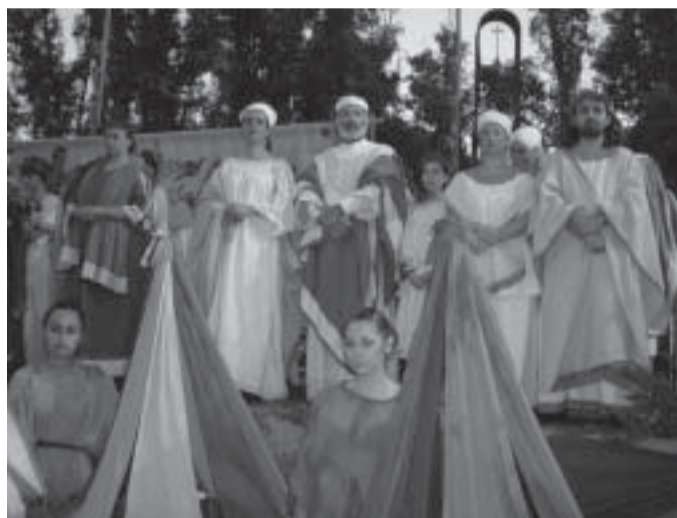
Le famiglie "Velimna" e "Cai Cutu" con il loro seguito assistono alla proclamazione del Grande Re dei Lucumoni