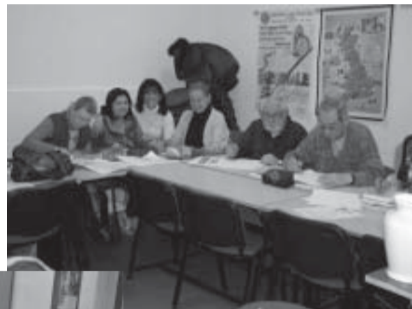
Università della Terza Età: lezione di disegno

eventuali malattie allo stadio iniziale. È opportuno anche precisare che i farmaci, in specie gli psicofarmaci, di grande ausilio quando effettivamente necessari, vanno usati in modo mirato previo consiglio medico.