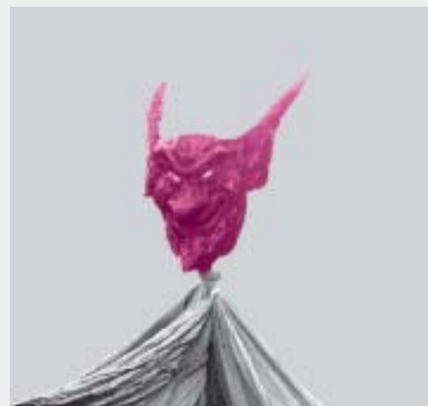
Maschera del Dio demone "Pheru"

Fuoco Sacro! Fuoco di atleti, di spiriti forti; Fuoco di terra, Fuoco di cielo. Grande fuoco per gli Dei.