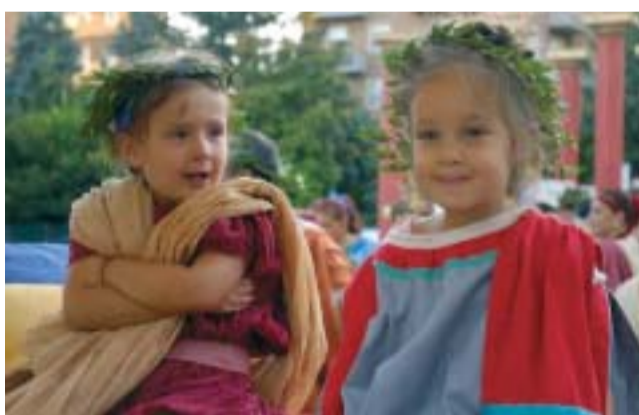
Due piccole "debuttanti" etrusche (foto pubblicata con l'autorizzazione dei genitori)