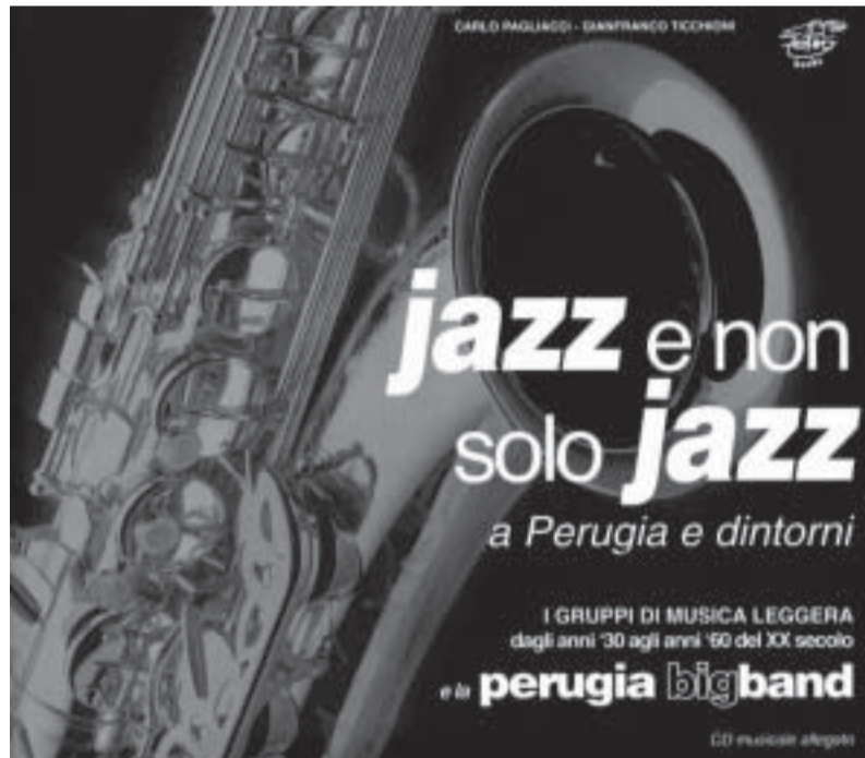
Copertina del libro Jazz e non solo jazz a Perugia e dintorni .