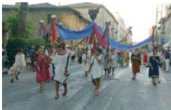
Velario con maschera del Dio demone Phersu