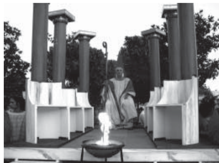
Il Grande Re dei Lucumoni sul trono dopo la proclamazione