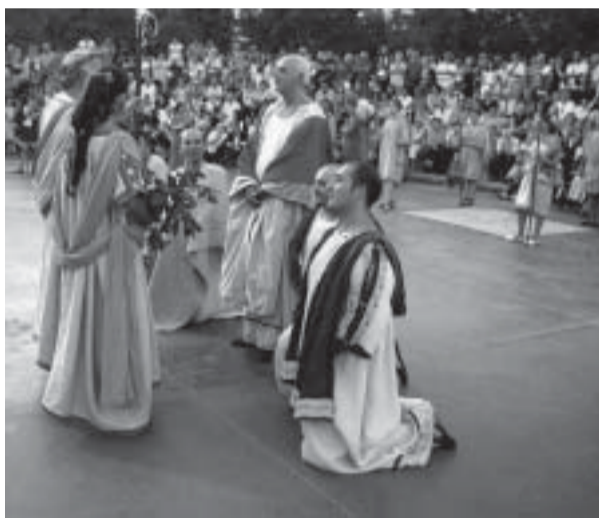
La proclamazione del Grande Re dei Lucumoni