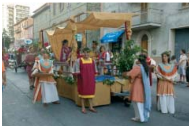
Carro con la famiglia nobile