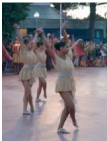
Danzatrici in esibizione