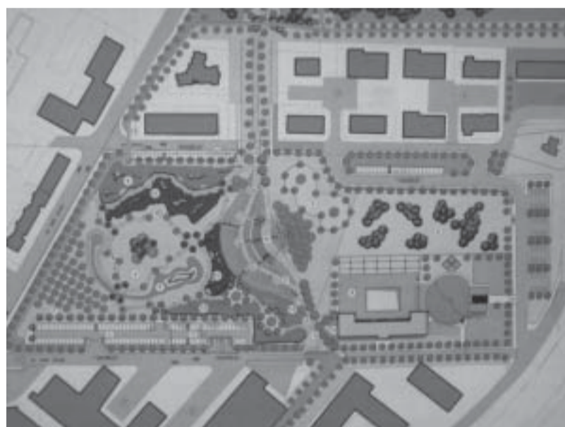
Progetto del parco urbano.

Quest'opera, inserendosi nel processo di trasformazione che da qualche anno sta investendo, su più fronti, il territorio perugino, fu presentata alla cittadinanza per la prima volta nel 2004, quando cioè si concluse positi-