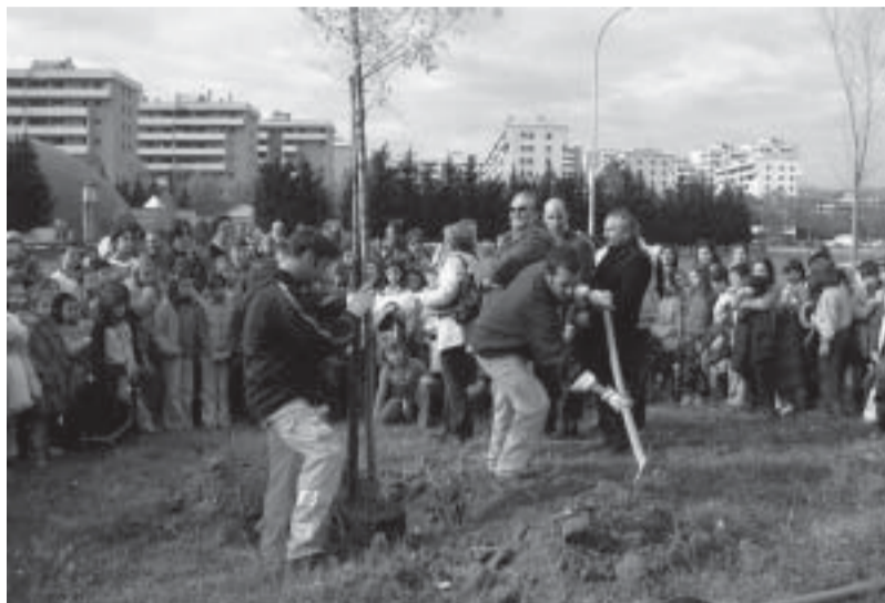
Messa a dimora dell'albero, simbolo del nuovo parco urbano.

rispetto dell'ambiente e le sue problematiche". Di cosa stiamo parlando? Dell'imponente parco urbano di via della Scuola. Proprio lo scorso 15 novembre, con la messa a dimora di un olmo campestre e la firma del contratto con la società vincitrice dell'appalto, il Comune, rappre-