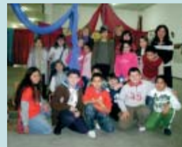
Il gruppo degli alunni in visita con le insegnanti.

Tra le iniziative che hanno visto protagonista la "Pro Ponte" non possono non essere ricordate le visite da