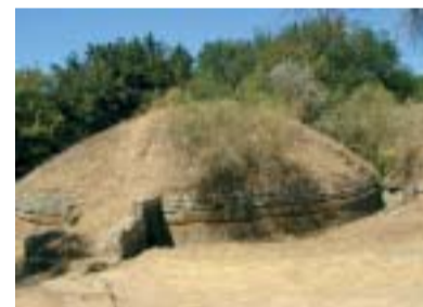
Tumulo II, con all'interno quattro tombe di differenti periodi storici.

Continuando lungo il percorso arriviamo a uno degli esempi più rappresentativi di complesso monumentale con tombe a camera: il Tumulo II, che include quattro tombe di differenti periodi. Il tu-