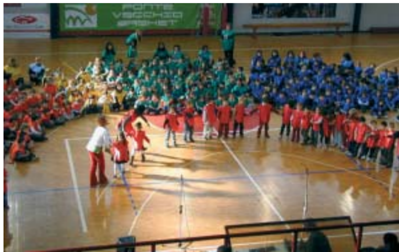
L'esibizione dei bambini al Palazzetto dello Sport.

grazimenti all'Associazione Sportiva Ponte Vecchio Basket e a tutti coloro che hanno collaborato per la