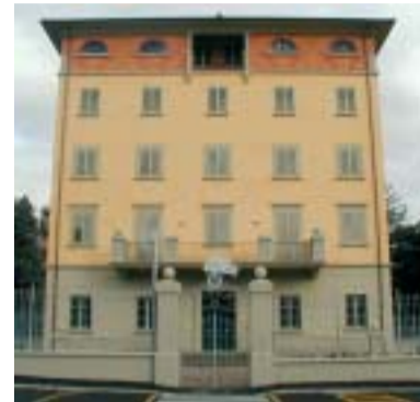
Veduta frontale della nuova caserma.

Attendiamo con ansia l'inaugurazione della nuova caserma dei Carabinieri anche se, detto tra noi, avremmo preferito che tale spazio fosse stato destinato ad una struttura polivalente in sostituzione del vecchio e decrepito CVA e che la caserma fosse stata costruita nelle vicinanze di via dei Loggi, come