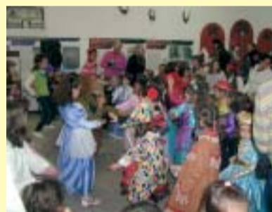
Un momento della manifestazione.

Domenica 20 gennaio presso la nuova sede della "Pro Ponte" si è svolto il "Carnevale dei bambini" in maschera. Le adesioni sono state molto superiori alle attese, tanto che la vasta sala è risultata insufficiente. La festa era a tema libero, per cui i bambini si sono presentati ostentando con orgoglio innocente i loro costumi multicolore di personaggi più svariati, frutsono poi dispersi giocosi nella sala sta con stelle filanti e nastri colorati. Uno scenario variopinto in cui le mescolate ai sorrisi e alle felici nonni presenti. Da sottolineare si bimbi extracomunitari alla fessoso di integrazione multiculturale quindi della nostra società, sta Il pomeriggio è stato animato da con grande professionalità hantire i piccoli partecipanti con giochi e musiche di carnevale nel corso dell'intero appuntamento.