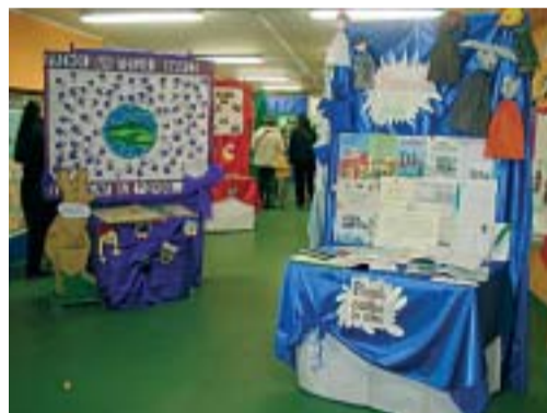
Immagini della mostra.

tivo dell'Istituzione. Al termine della cerimonia sono stati rivolti sentiti rin-