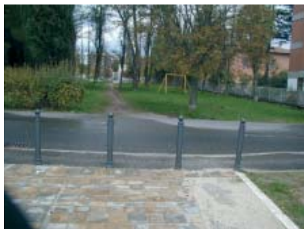
Percorso di collegamento tra le due aree verdi dove si chiede l'installazione di un adeguato dosso di rallentamento per le auto.

Appello firmato da 212 cittadini e residenti