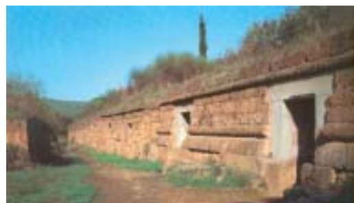
Tomba a dado o a cubo

complessi; ora, probabilmente in conseguenza di leggi contro il lusso, che conosciamo a Roma e in Grecia, comincia un processo inverso. All'inizio le tre celle (del tipo della tomba della Cornice) sono ridotte a due (V secolo a.C.), quindi troviamo