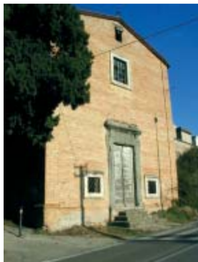
Veduta frontale della chiesa.

Dai documenti in nostro possesso non si ricava il nome di colui che ha disegnato il sacro edificio. “C'è chi conget-