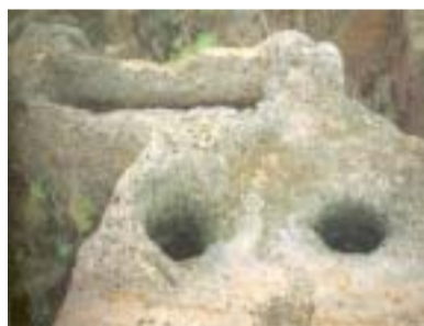
Contenitori in tufo "Ziri"

da comprendere, grazie all'analisi di alcuni contesti rappresentativi, il processo evolutivo dei tipi tombali, riflesso dei cambiamenti avvenuti al-