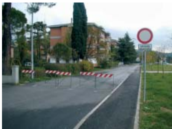
Veduta dello sbarramento e delle abitazioni ora isolate.