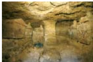
Tomba del letto funebre.

Si tratta di una sepoltura ipogea, rinvenuta inviolata, scavata nel bancone travertino. E' preceduta da un lungo dromos e da un lastrone di chiusura in travertino. La camera sepolcra-