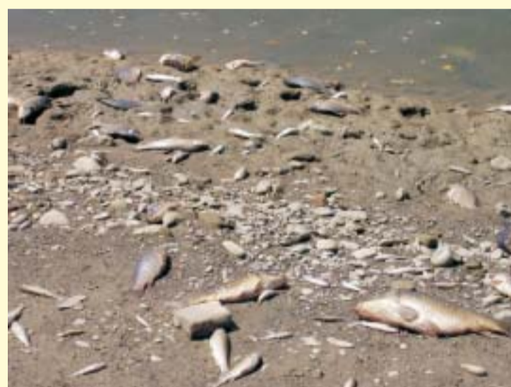
Lo scenario desolante sulla riva del Tevere