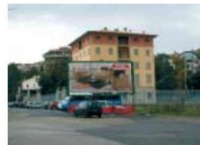
Veduta laterale con il cartellone di troppo.

Le colorazioni sono di tono equilibrato, arricchite nella parte in alto, di decorazioni geometriche avvolgenti molto suggestive. Confidiamo che prima dell'inaugurazione venga rimosso il grande tabellone pubblicitario che, come si può notare dalla foto, impedisce e deturpa la veduta della caserma dal lato del mercato. Il tabellone, come sappiamo, garantisce un interessante introito pubblicitario per il Comune che però verrebbe comunque salvaguardato se venisse spostato e collocato