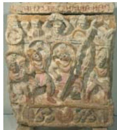
Urna con il mito dei Sette contro Tebe.

sonaggio, con scudo bilobato e pietra nella destra pronta per essere scagliata, al centro un guerriero con le mani alzate intento a gettare una pietra sugli assalitori, quindi un quarto personaggio con il corpo riparato da uno scudo, chiude un quinto personaggio che, con le braccia alzate, scaglia una pietra, la