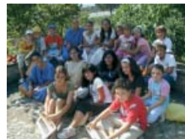
Il gruppo dei partecipanti alla Caccia al Tesoro

L'apprendimento si è basato innanzitutto sul luogo, tanto sconosciuto (ai