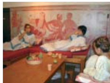
Sala dei triclini

cato da una mappa e costellato di prove e culminata con il ritrovamento dell'antico tesoro dei Cutu nell'Ipogeo dei Volumni (con l'apparizione di un fantasma etrusco per il brivido finale). I bambini, divisi in piccoli gruppi, si sono ritrovati coinvolti in una fantastica avventura di 2500 anni fa, in un'atmosfera suggestiva.