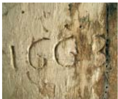
La data di costruzione della chiesa incisa sul portone principale.

(1) Soluzione: “Ti sei divertito. Ricordati che il vero tesoro da scoprire è Gesù. Ciao!”