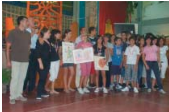
La premiazione dei vincitori dell'Estemporanea.