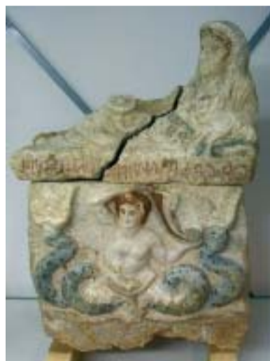
Urna con il mito di "Scilla".

Un'altra bellissima urna presenta il coperchio con defunto recumbente a capo velato ed iscrizione etrusca un tempo rubricata; la cassa presenta un rilievo con scena di dextrarum iunctio ovvero di matrimonio: al centro un uomo e una donna che si stringono la destra, a sinistra un'ancella con una "cista" in mano, ovvero un cofanetto portagioielli e oggetti da toeletta; chiude a destra un personaggio maschile con corto mantello e scudo rotondo. L'al-