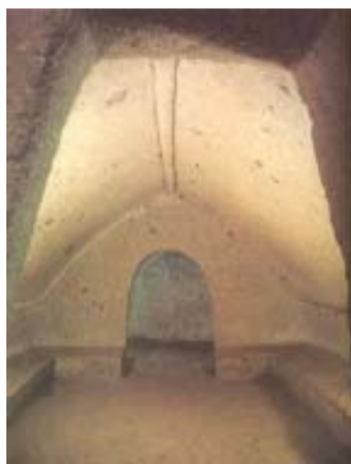
Tomba della Capanna

La tomba più antica del Tumulo II è quella della Capanna, degli inizi del VII secolo a.C.. Accessibile attraverso un lungo corridoio ("dromos") e completamente scavata nel tufo, l'interno della tomba replica fedelmente l'aspetto delle più antiche abitazioni etrusche (capanne): due camere una dietro l'altra, delle quali la prima (la "camera pubblica") ha un soffitto a doppio spiovente imi-