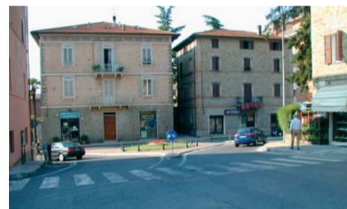
Spazio da destinare alla rotonda

lunità per i pedoni. Da troppi anni c'è un'immobilità totale davanti a questi problemi che appesantiscono e limitano la vita delle persone. E' tempo di muoversi e di iniziare ad applicare tempestivamente dei provvedimenti che snelliscano il traffico, come la creazione di questa rotonda, la costruzione di piste ciclabili dentro il paese, il ricorso al "bike-sharing" (letteralmente "noleggio-biciclette") o comunque area attrezzate per riporvi biciclette per chi viene dai quartieri limitrofi al centro del paese, lasciando l'auto parcheggiata e girare in sicurezza nel paese; opportuna anche la presenza nelle ore di punta pomeridiane di forze dell'ordine per evitare la sosta selvaggia che provoca un imbuto nelle strade ed enormi file. Non si chiede certo la multa per aver sfiorato anche di soli due minuti il disco orario, ma si chiede una presenza educativa, che insegni a tutti l'uso corretto dei parcheggi e la limitazione della velocità che mette in serio pericolo l'incolumità soprattutto di bambini ed anziani, troppe volte vittime