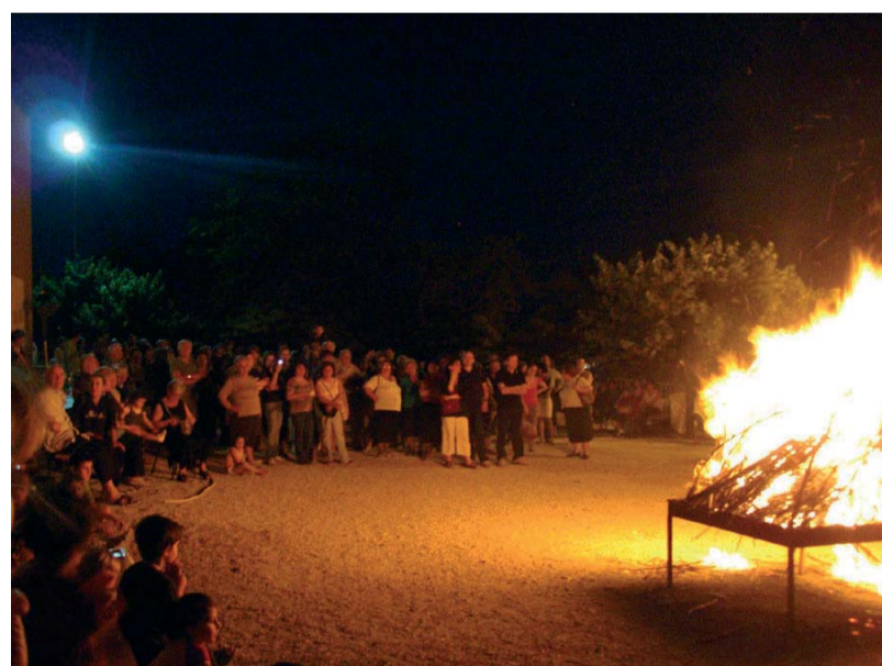
Il grande “falò” acceso la sera della vigilia di San Giovanni Battista

i cibi preparati dalle sapienti mani delle signore della parroc-