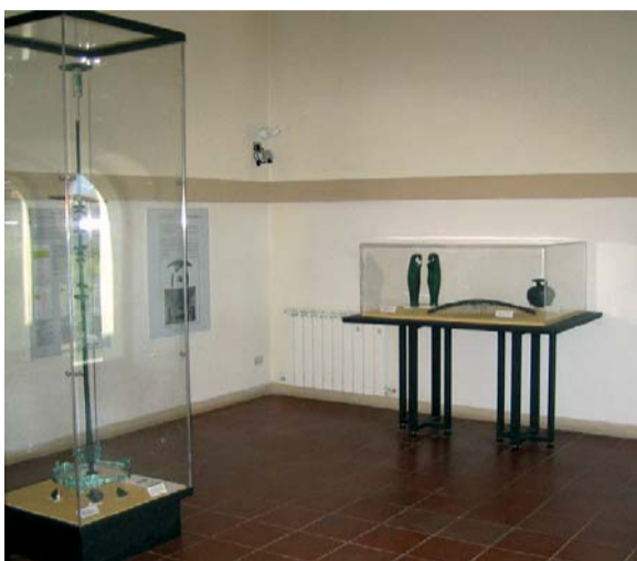
Una sala espositiva dell'Antiquarium

Al centro dell'atrio e del tablino pendevano due lucerne in terracotta con giovane alato (Apollo o amorino), nudo con lungo mantello, poggiante su vasca a più beccucci, con testa di Medusa sul fondo. Nel primo cubicolo, a destra e a sinistra entrando, ed a sinistra del