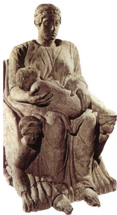
Statua-Cinerario della "Mater Matuta" dalla Necropoli della Pedata di Chianciano Terme V sec. a.c. - Firenze, Museo Archeologico