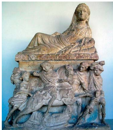
"Fasti Nacerei, moglie di Velimna". Necropoli del Palazzone fine III-II sec. a.c. - Perugia, Museo Archeologico Nazionale dell'Umbria.

ne legate al mondo della casa e alle attività connesse. E' così possibile valutare più agevolmen-