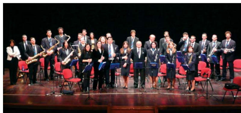
La Banda di Gualdo Tadino

Gli arrangiamenti dei brani proposti sono originali per banda e comprendono brani jazz, latino-americani e cubani, musica italiana, di autori come Stan Kenton, George Gershwin, Antonio Carlos Jobim, Perez Prado, Ennio Morricone. Alcuni di essi sono arrangiati per voce femminile e banda. La Banda Musicale "Città di Gualdo Tadino" risulta sempre attiva dal 1853.