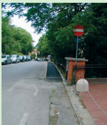
Il nuovo marciapiede

Ma torniamo al nostro problema, perché vorremmo suggerire una soluzione che potrebbe consentire al cittadino-pedone di poter percorrere liberamente e in piena sicurezza l'intera via Nino Bixio. Riteniamo, infatti, che se si eliminasse parte del parcheggio delle auto sulla parte destra, a ridosso del "greppo" destinando tale spazio alla carreggiata per