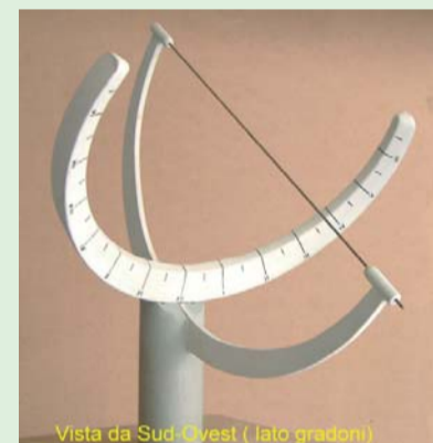
Vista da Sud-Ovest (lato gradoni)

sentano di valutare l'ora del momento. Purtroppo, per mancanza di un adeguato spazio assolato, complici i numerosi alberi presenti, dovremo ripiegare su un sistema