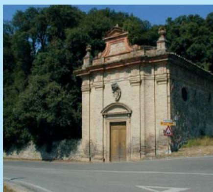
La "Chiesetta" del Parco Baglioni

campagna e dell'edilizia degli insediamenti agricoli dei secoli scorsi e che l'ottimo stato di conservazione degli edifici, il buono stato vegetativo degli alberi secolari di alto fusto, il se-