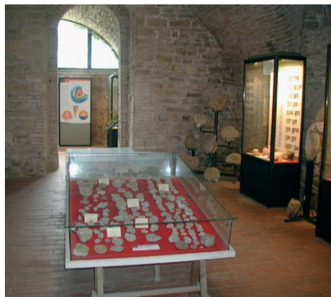
Una sala del Museo dei fossili

Subito dopo si riparte verso Apecchio. Borgo a circa 500 metri di altitudine risalente al primo Medioevo, di poco più di 2.000 abitanti, frequentato da villeggianti e posto tra colline ricoperte di fitta vegetazione di querce e pini. Il nome di questo luogo sembra derivare da "apicula" (piccola ape) o "apice" (altura posta alla confluenza fra il Biscubio e il Menatoio). Crocevia tra Marche, Umbria e Toscana, rifugio di tutte le civiltà, Apecchio