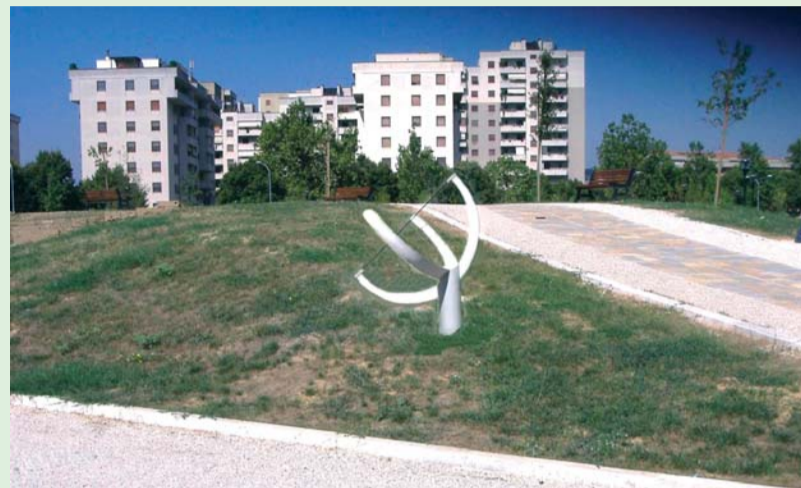
Veduta del Parco con l'ipotetica collocazione dell'orologio solare

L'orologio, o mediana, nel parco potrebbe essere realizzato con uno stilo di circa sei metri posto in un luogo ben assolato e inclinato verso nord, di un angolo pari alla latitudine locale, in modo che la sua ombra si proietti sul piano orizzontale, dove opportune pietre o cordoli posti al livello del terreno con-