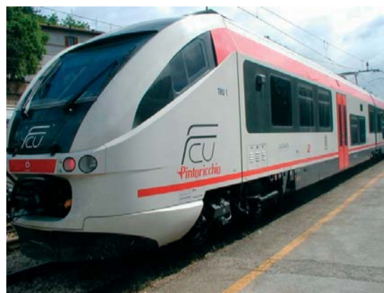
L'elettromotrice de "Il Pintoricchio"

nologia; non mancava, a dare una nota di colore, una rappresentanza della futura generazione: gli alunni della locale Scuola Elementare e Media, accompagnati da insegnanti e genitori.