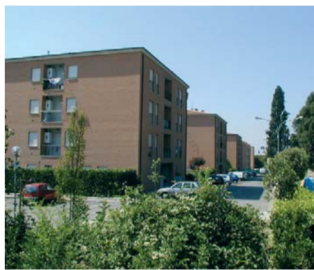
I cinque blocchi di case popolari

logico Nazionale, l'Ipogeo dei Volumni e il Centro di Perugia. Riteniamo che grande merito di tutto