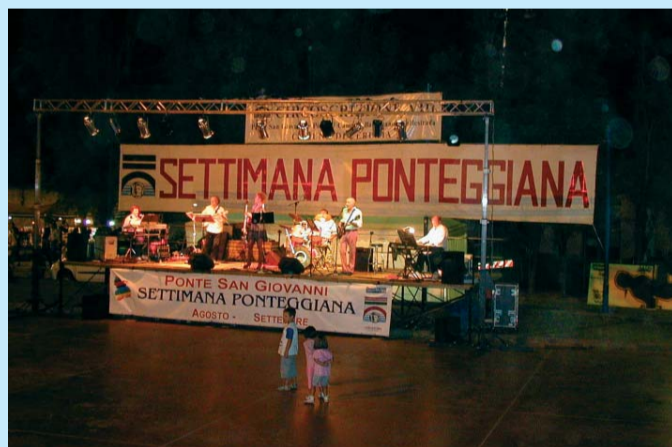
La performance de "I Premiers"

La "Pro Ponte" e la "Pro Ponte Etrusca Onlus" esprimono i propri più sinceri complimenti e apprezzamenti alla "Consulta dei Rioni e delle Associazioni" e a tutti coloro che a vario titolo hanno collaborato alla realizzazione e alla riuscita della "Settimana Ponteggiana 2008", per il ricco e stimolante programma proposto, come dimostrato dall'ampia adesione di pubblico registrata durante i dieci giorni della manifestazione.