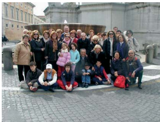
Il gruppo "Pro Ponte" in trasferta a Roma

statua in marmo, raffigurante la grande imperatrice Vibia Sabina,