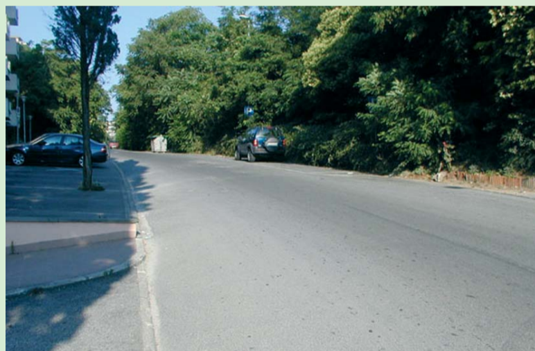
Il curvone per il quale si richiede l'adeguamento e il marciapiede

le auto (tanto più che le stesse sono portate dalla curva a stare più sulla destra, piuttosto che al centro della strada quando salgono), si potrebbe destinare parte dello spazio guadagnato, diciamo 80-100 cm., alla costruzione del pezzo di marciapiede mancante sulla sinistra, senza pregiudicare l'utilizzo del parcheggio condominiale. Riteniamo che sia una proposta ragionevole e fattibile: speriamo che stimoli una seria riflessione in seno al Consiglio di Circoscrizione.