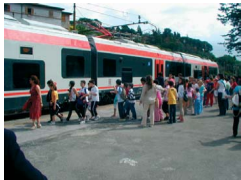
Studenti mentre salgono su "Il Pintoricchio"

Quando si parla di Pintoricchio, il pensiero corre subito al grande artista che ha abbellito, con la sua arte, chiese e palazzi e le cui opere custodite nei musei di tutto