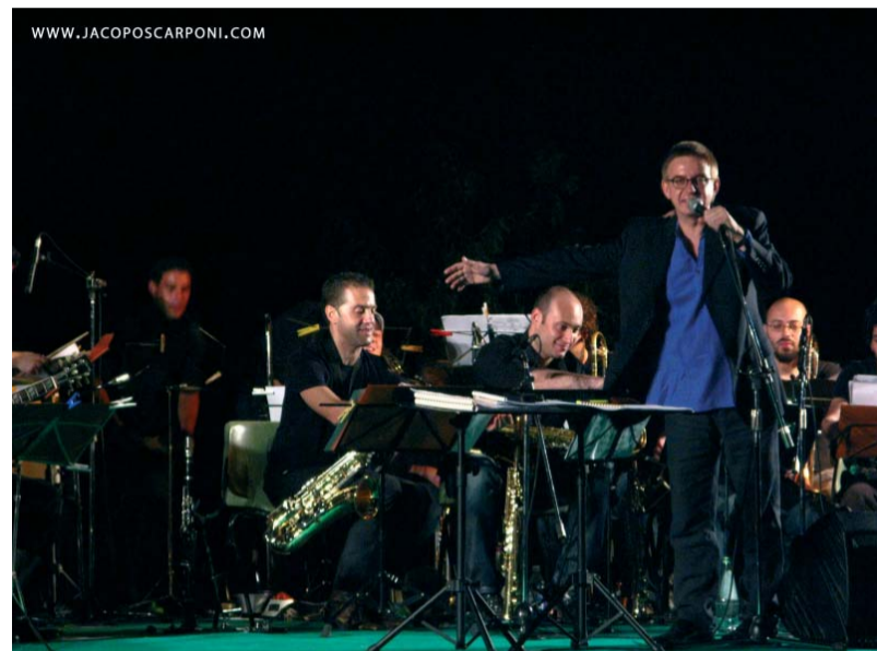
Un momento del concerto della "Perugia Jazz Orchestra"

lata da oltre 250 alberi autoctoni ad alto fusto oltre a 470 arbusti e cespugli. Le panchine dislocate lungo i numerosi percorsi pedonali rappresentano un ottimo invito al riposo e stimolano la lettura di un buon