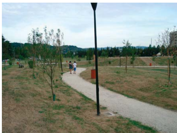
Uno scorcio del nuovo Parco di Ponte San Giovanni

si intensifica l'attività di controllo dei vigili urbani in queste zone?