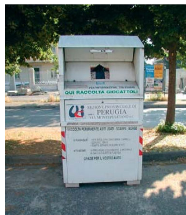
Il contenitore "Pro Africa"

Appello della "Pro Ponte" a usare correttamente i contenitori sulle strade della frazione perugina