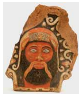
Terracotta policroma rappresentante Sileri; decorazione del tetto del tempio