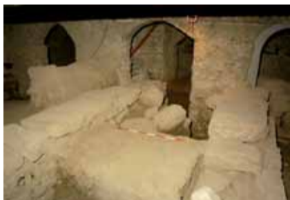
Murature etrusche facenti parte del terrazzamento

sa perugina è costruita sopra l'antico foro etrusco-romano, dentro il perimetro della possente cinta muraria etrusca.