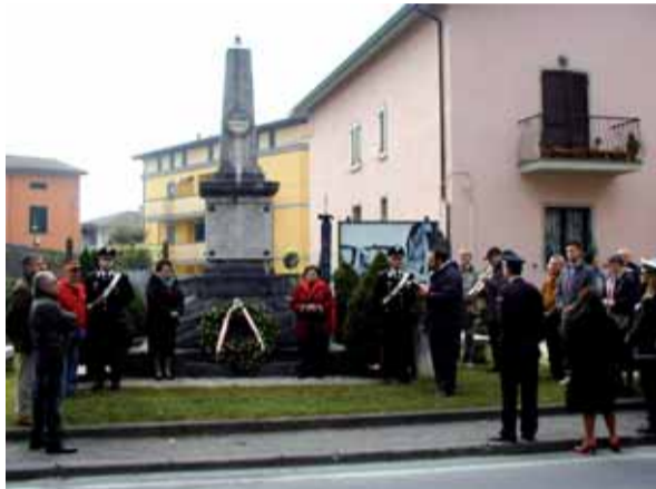
Un momento della commemorazione ai caduti

La cerimonia è poi proseguita con la deposizione di una corona d'alloro da parte di due Garibaldine in perfetta divisa rossa, alla presenza delle autorità militari e civili e con la Santa Benedizione impartita dai parroci don