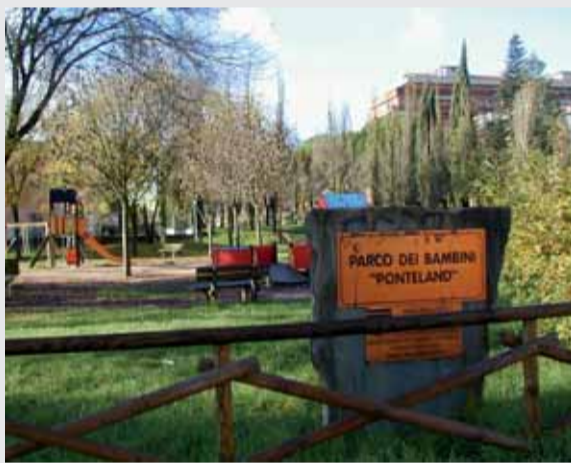
Scorcio del parco dei bambini "Ponteland"

nuovo "Central Park" (ma chi li dà i nomi a questi posti?), un'area molto assoluta e dunque, così com'è, del tutto inadeguata per i bambini. Avevo già espresso in un'assemblea pubblica al sindaco le mie perplessità sul progetto e in particolare sul fatto che, come al solito, la decisione fosse stata presa senza alcun coinvolgimento della cittadinanza. Davanti a tutti il sindaco si era impegnato: "Prima di decidere qualunque cosa ci rivedremo" . Voci, ora, dicono che l'inizio dei lavori sia imminente, che presto verranno abbattuti gli alberi e che verrà occupato anche lo spazio adiacente al parco giochi, l'area in cui - giostre e gonfiabili permettendo - di solito