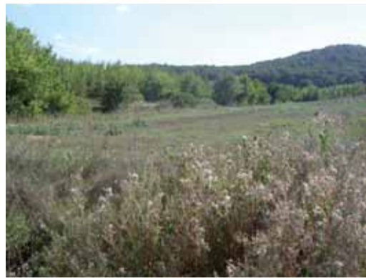
Scorcio del bosco di Collestrada

in zona D5 per le piccole industrie, attività artigianali e com-