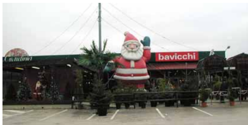
Il nuovo Garden Center di Ponte San Giovanni

Il "Centro metri"! Chi è costui? Niente paura: si tratta di un kit completo per realizzare un tappeto verde in cento metri quadrati