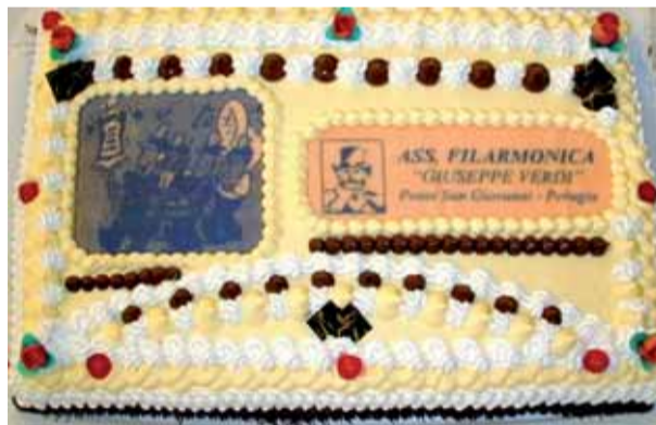
La magnifica torta multicolore offerta dalla ditta Alunni

Il Direttivo della "Filarmonica G. Verdi"