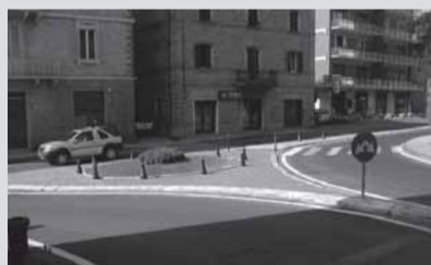
L'area della futura rotonda

L'Amministrazione comunale, anche sollecitata da un gruppo di cittadini, sta approfondendo tutti gli aspetti tecnici e di mobilità urbana per una diversa regolazione dell'incrocio tra via Bixio e via Manzoni, lato via Pieve di Campo. Si sta in particolare valutando la possibilità di introdurre una rotonda di piccolo diametro, onde permettere il più rapido collegamento del traffico proveniente da via Adriatica e diretto in Via Pieve di Campo evitando così l'attuale itinerario che prevede invece l'utilizzo di via Manzoni in discesa e via Bixio in salita, con