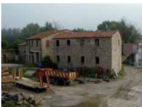
Ex mulino sul Tevere da recuperare e destinato a futuri Servizi Pubblici

re i pedoni dal traffico automobilistico, le due piazze, il parco pubblico attrezzato e gli interventi sulla viabilità richiesti e definiti al termine della concertazione come opere di pubblica utilità, che vanno a ricadere anche fuori dal comparto in oggetto, ma che l'amministrazione comunale ha ritenuto importante chiedere alla Società proponente. Un milione e 460mila euro definiti come "contribuzione aggiuntiva concertata" rappresentano, appunto, l'onere che la proprietà deve sostenere in aggiunta agli oneri di urbanizzazione, calcolato sulla base dell'incremento di volumetria ottenuto nella fase di concertazione con il Comune; tale somma non sarà corrisposta in denaro, ma attraverso la realizzazione delle opere pubbliche di cui sopra e possiamo dire che, da una prima valutazione, il valore delle opere previste supera anche quello strettamente dovuto (vorrei precisare che la concertazione è prevista e regolata dalle norme che riguardano le Aree Centrali a Funzione Integrata-AC.FI anche per la determinazione del valore economico dell'onere aggiuntivo).