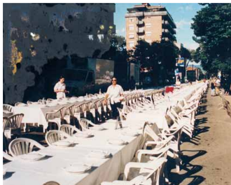
Giugno 1998, preparazione della "mitica" e ancora tanto richiesta Tavola lunga

tavano brevi notizie associative, dati su Ponte San Giovanni, i risultati di un questionario sulle criticità della frazione. Per