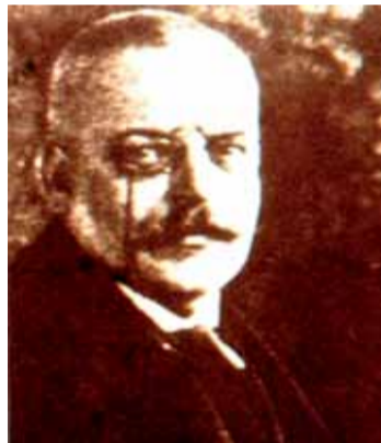
Alois Alzheimer, scopritore della malattia

La malattia di Alzheimer rappresenta il prototipo delle demenze, cioè una condizione di deterioramento mentale primitivo e progressivo, non reversibile né almeno al momento -arrestabile e che coinvolge uniformemente le funzioni psichiche superiori, precedentemente acquisite, in un individuo che non presenta alterazioni dello stato di coscienza. In particolare, nel soggetto affetto dall'Alzheimer risultano compromesse la memoria, inizialmente solo per i fatti recenti, e la capacità di risolvere i problemi della vita quotidiana. Da rilevare che la malattia di Alzheimer rappresenta circa il 50% di tutte le forme di demenza, mentre un 20% è dato dalle demenze vascolari e un altro 20% dalle forme miste, cioè in parte su base neurodegenerativa tipo Alzheimer ed in parte su base vascolare, forme molto comuni nei pazienti ultraottantenni; infine, il restante 10% è rappresentato da forme di demenza secondarie causate da alcolismo, malattie infettive, carenza di vitamina B12, alterazioni endocrine in specie della tiroide, farmaci sedativi. Per quanto riguarda in particolare la malattia di Alzheimer è bene precisare che presenta un progressivo incremento con l'età e che la durata media di sopravvivenza dei pazienti è di circa 10 anni dall'inizio della patologia. La causa della malattia di Alzheimer è tuttora sconosciuta; tuttavia, è stata ormai riconosciuta una pre-