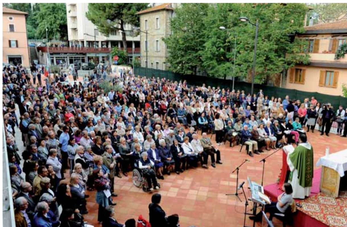
Piazza don Annibale Valigi durante la Santa Messa

voce ha accompagnato musicalmente la parte finale della manifestazione. Nel complesso, l'atmosfera familiare, di serena convivialità, divertimento per adulti e bambini, ha decretato il successo dell'ini-