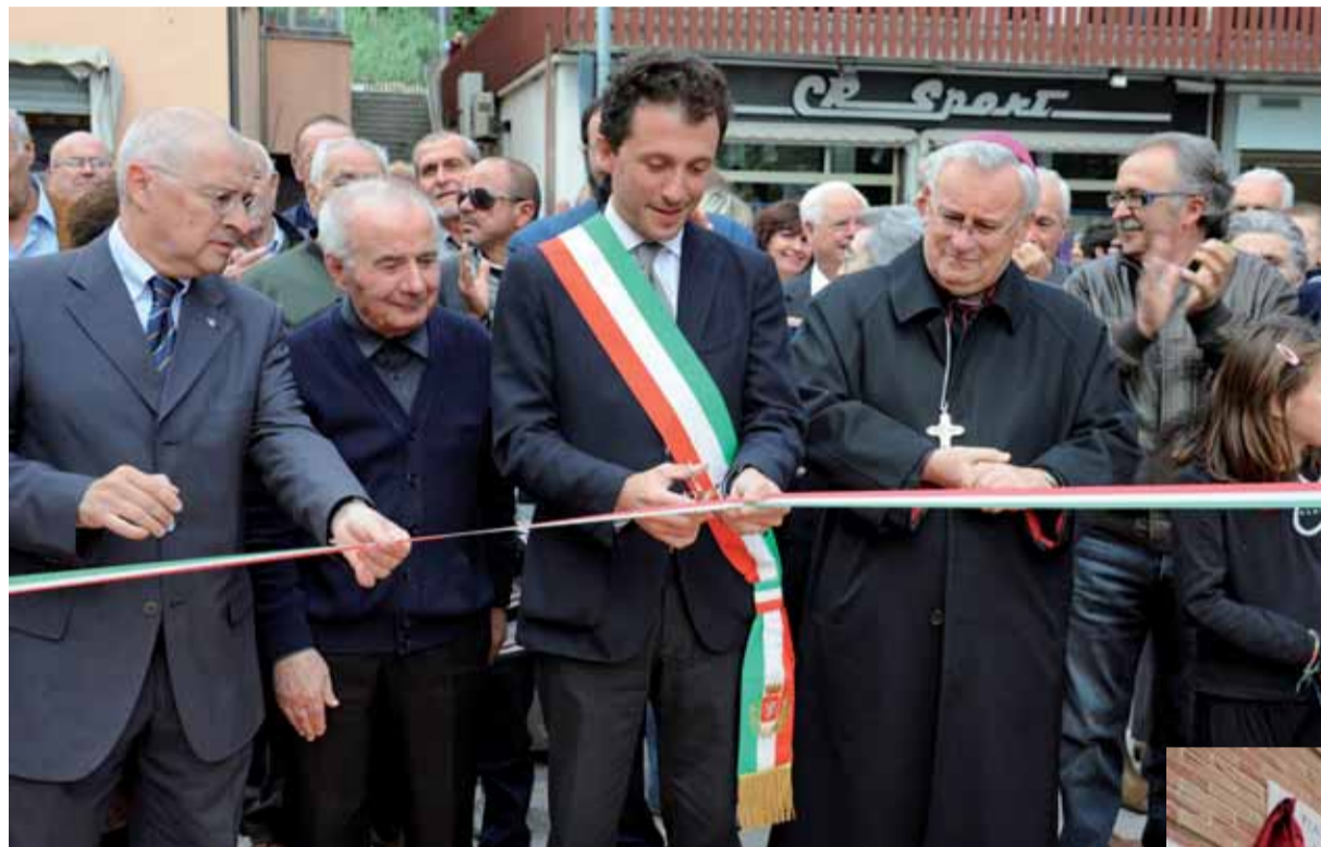
Le autorità al taglio del nastro