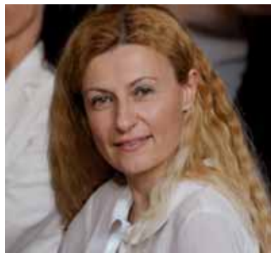
di Valeria Cardinali*

Le destinazioni restano quelle ormai conosciute ed indicate nella scheda tecnica dello Studio Signorini, compresa le superfici previste per il direzionale (quindi gli uffici), anche se non sarà utilizzato direttamente come sede degli uffici della Colussi, i quali ormai sono collocati in un'altra parte della città per autonoma decisione della società. Dai colloqui intercorsi sappiamo anche che la previsione di trasferimento del personale a Milano si è attuata.