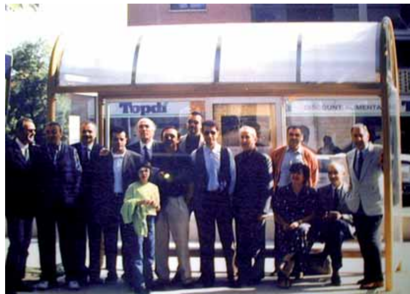
Settembre 1997, i consiglieri della Pro Ponte inaugurano la prima pensilina

solo ovviamente in modo gratuito. Il primo articolo cominciava proprio come questo che state scorrendo: "C'era una volta...". Nel tentativo di stimolare la memoria per le cose del Ponte e salvaguardare la propria identità. Iniziative, temi "storici" quali il traffico, le pensiline, le aree verdi, il vecchio mulino, i percorsi pedonali, l'urbanizzazione a farla da padrone. Con l'aggiunta di una pagina pubblicitaria (la quarta di copertina) per coprire le spese grazie all'allora Cassa di Risparmio di Perugia. Dal secondo numero cominciò ad ampliarsi il numero degli inserzionisti (un grazie sentito va a quelli di ieri e a quelli di oggi, semplicemente fondamentali) e si cambiò il formato da foglio A5 a foglio A4. Ci vorranno alcuni numeri per trovare la chiave definitiva a livello grafico e tecnico, ma lo spirito fu chiaro da subito. Oltretutto non scri-