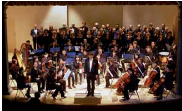
La "Seoul Central Symphony Orchestra" con la Corale Polifonica "Volumnia" e il Coro di Santo Spirito di Perugia.

un traguardo importante, una tappa fondamentale per un percorso di crescita globale.