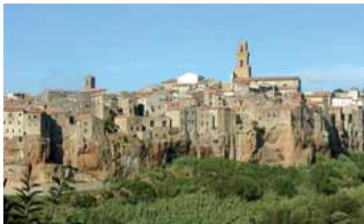
Panorama di Pitigliano

Appena arrivati veniamo accolti da alcuni rappresentanti del