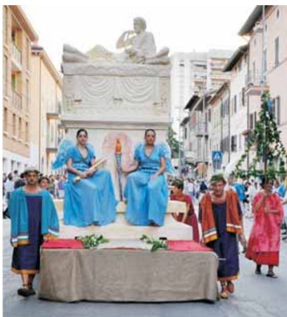
Il carro con la fedele riproduzione del sepolcro modellata dall'artista Giorgio Pucciardini

sotto le quali si alternavano urne e vasi cinerari, per arrivare alla porta degli inferi "Arco Fiorito", dove