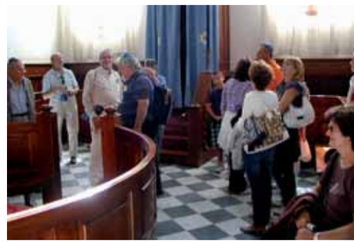
Il gruppo in visita alla sinagoga

varie fasi del processo enologico si svolgevano sotto il diretto controllo del rabbino che, al termine