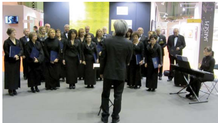
Un momento della performance parigina

Rutter, Denza, Rossini, Verdi ed Althouse che hanno variato nei contenuti spaziando dai canti della tradizione