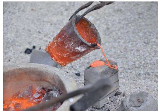
Getto del bronzo fuso nello stampo