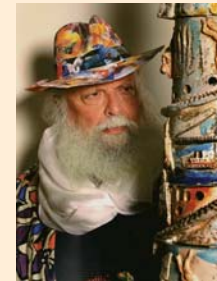
La "Pro Ponte"

Riconoscenti anche per le altre opere donateci in precedenza, auguriamo all'amico Fioroni sempre più colorati successi.