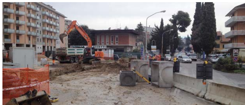
Nuova rotatoria innesto E45, lavori in corso

mento di Via dei Loggi-Via Volumnia con Via Adriatica, il cui progetto è in corso di appalto e la rotatoria di Via Adriatica-innesto E 45 i cui lavori sono già iniziati e si prevede di completarli entro giugno del 2013. Il costo di queste due infrastrutture è di oltre 5 milioni di euro. "Per il momento - dice Liberati - via Adriatica rimarrà a doppio senso di circolazione perché per l'attuazione dello schema finale che prevede, di fatto il raddoppio di Via Adriatica con due corsie in ingresso sul sedimento attuale e due in uscita che invece dovranno essere