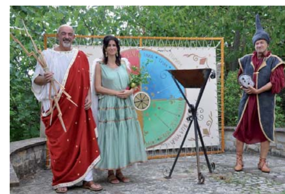
Tinia e Uni con l'Aruspice davanti alla volta celeste