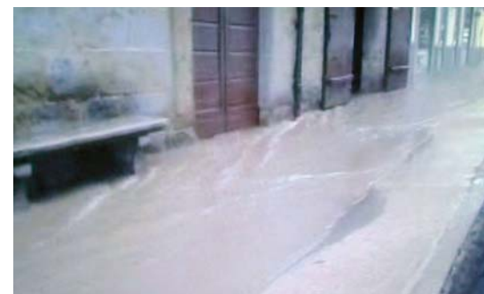
Fiume in piena in via Manzoni

La pioggia torrenziale che si è scatenata il 31 agosto scorso a Ponte san Giovanni ha messo in grave crisi soprattutto il sistema fognario di via Manzoni, che non è riuscito a recepire il copioso flusso di acqua piovana caduta a scroscio in poco tempo. La via in questione è così diventata un fiume in piena allagando alcuni locali a piano terra, come si può notare dalla foto qui riportata, tratta da un video amatoriale. Alcuni tombini della parte alta della via sono saltati liberando sporco di ogni genere che si è poi riversata a valle entrando in alcuni locali situati a piano terra.