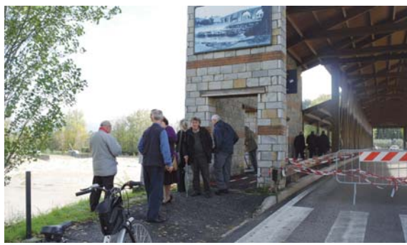
I ponteggiani di turno osservano preoccupati la piena

Il nuovo ponte inaugurato nel 2000 è subito diventato il punto