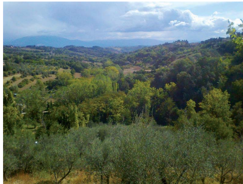
Veduta dal Pincetto della Valle di Santa Margherita