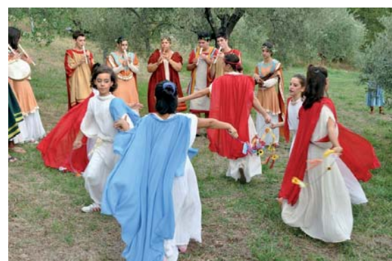
Danzatrici e musicisti con flauti e tamburi