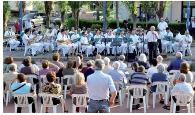
Una panoramica del concerto "Vinicio Pagliacci"