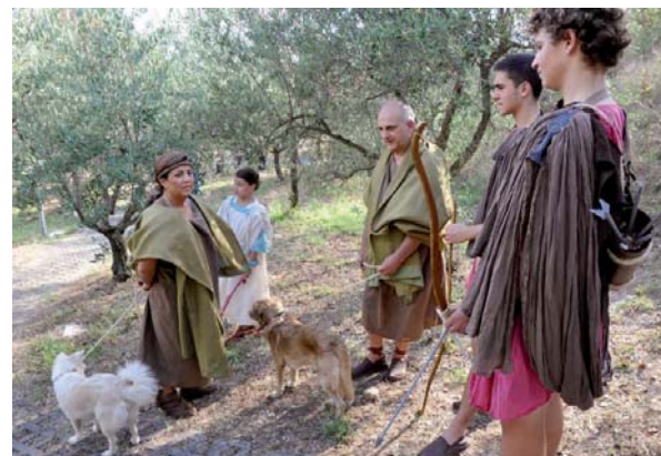
Scene di caccia con arcieri e cani