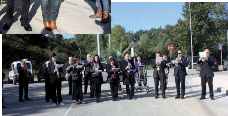
La banda della Filarmonica "G. Verdi" mentre esegue l'inno nazionale

Il posto scelto per la "fontanella" è certamente ottimale per la sua facilità di accesso e per la pre-