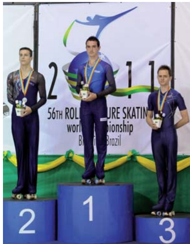
Simone Porzi sul podio a Brasilia dopo la vittoria del Mondiale 2011

In Italia tutti conoscono i volti dei calciatori che hanno vinto il mondiale nel 2006 in Germania. Sono tutti personaggi famosi, sempre in