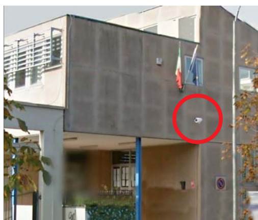
Facciata della scuola media con simulazione della telecamera

no talvolta preso d'assalto la scuola nelle ore notturne, provocando danni alle strutture e creando disagi a chi ne usufruisce, a chi ci studia e chi ci lavora, con costi enormi per la collettività.