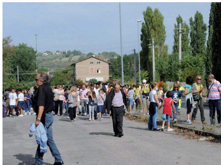
Il gruppo dei volontari si prepara a partire

quintali di rifiuti fra carta, plastica e vetro, il "serpentone" umano è rientrato al Palazzetto dello