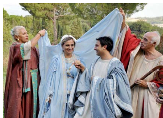
Scene da un matrimonio