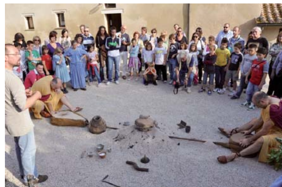
Dimostrazione delle tecniche di fusione dell'oro