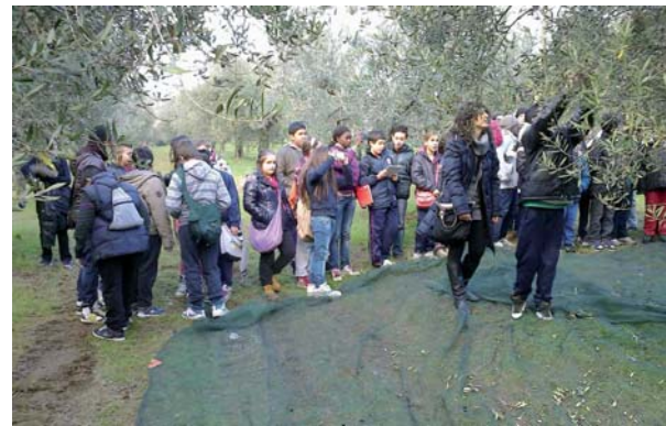
I ragazzi osservano attenti la raccolta delle olive

sezione "Bio" proprio l'olio del frantoio perugino.