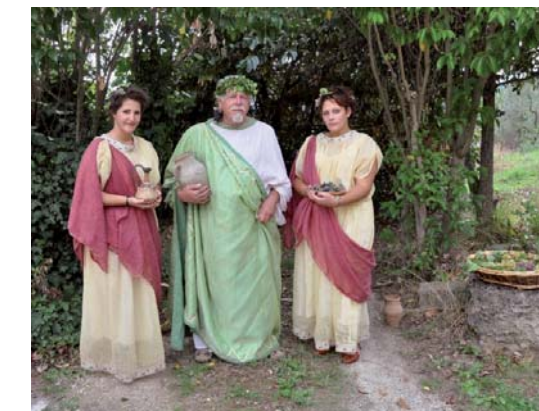
Bacco con le sue ancelle