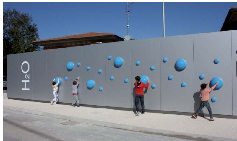
Alcuni bimbi giocano con il pannello esterno dell'impianto