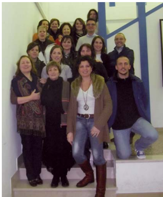
I componenti del nuovo consiglio d'istituto

ti, il nostro Istituto sta procedendo bene. Con il Consiglio di Istituto uscente sono state realizza-