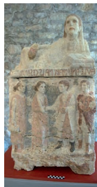
Urna n. 4, Anei Marcna