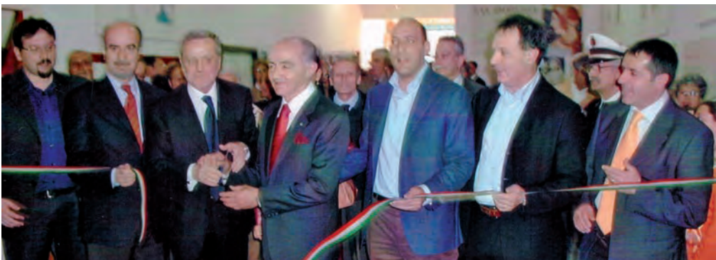
A sinistra l'inaugurazione della sede nel 2007